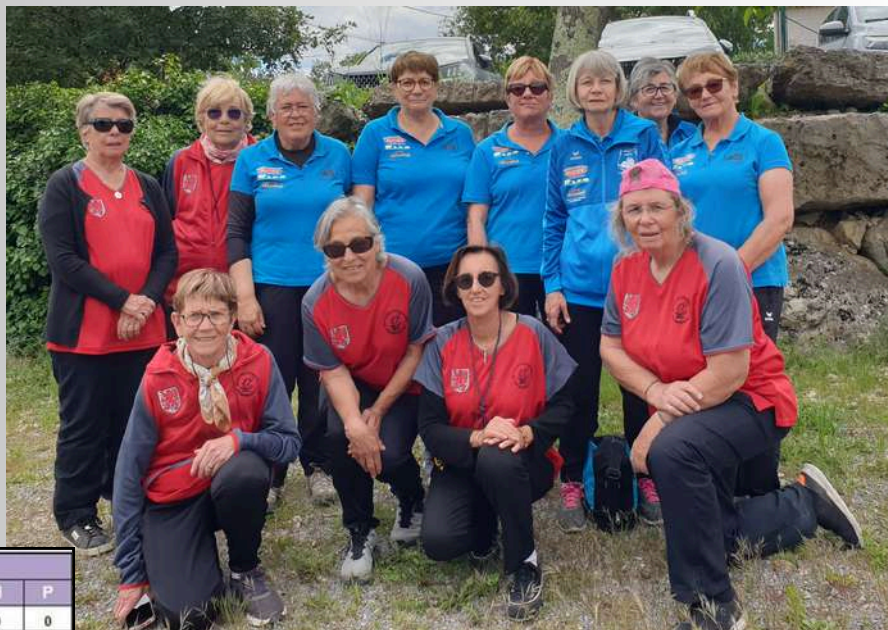
Contre l'équipe de Crussol arrivée N°1

Ce groupe, qui c'est formé juste au moment de la période pré-Covid, travaillant régulièrement tout au long des années sur leur technique, et avec force de convivialité - goûters communs à chaque entraînement ( pas retraitées pour rien...), resto, virée aux Masters de pétanque, ...etc - est restée soudée au fil des ans, ce qui l'a beaucoup aidé à bâtir leur cohésion d'équipe et de jeu.